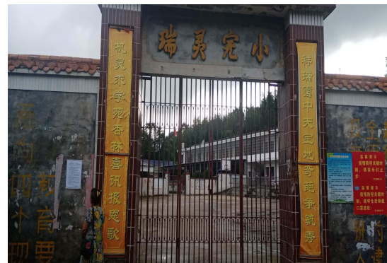
图 1.4-4 瑞灵完小公告栏公示