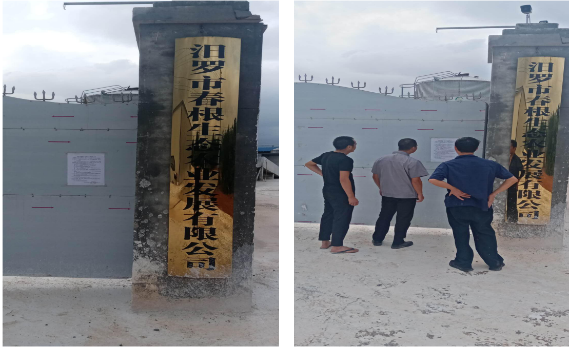
图 1.4-4 项目拟建地现场公示

现场公示张贴区域选择在项目拟建地、项目所在地村委会公示栏、项目附近瑞灵完小公告栏，张贴的时间为2020年7月29日至8月11日，共计10个工作日。