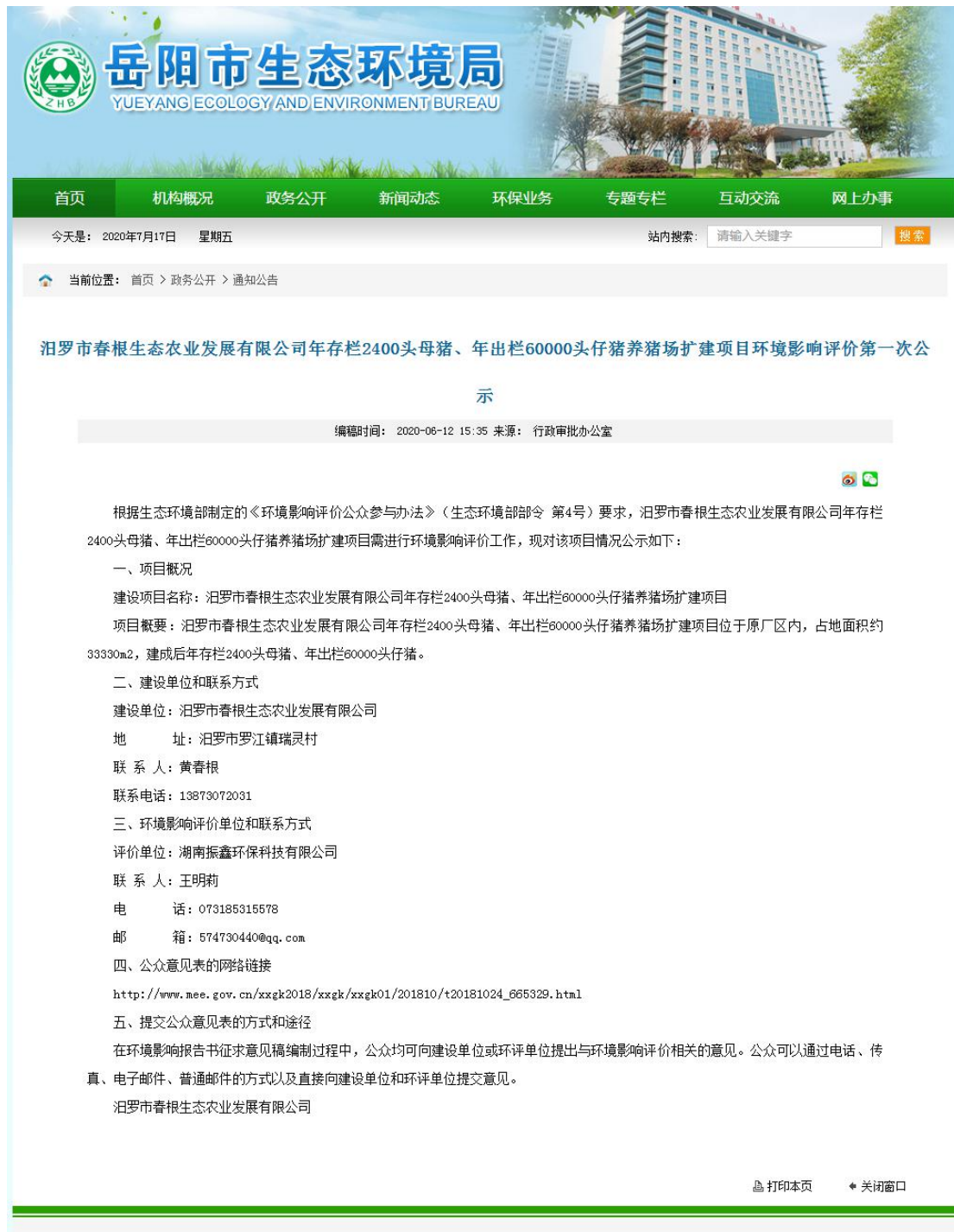
图 1.4-1 第一次网上公示截图