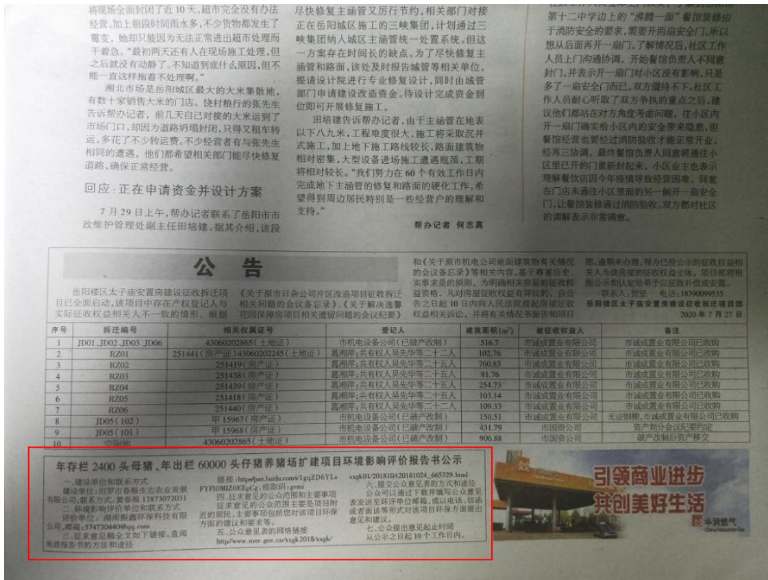
图 1.4-3 第一次报纸公示截图

2020年7月31日岳阳晚报对本项目征求意见稿进行了第二次报纸公示,公示截图见图 1.4-4 所示。