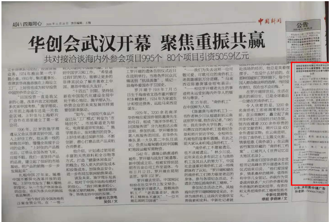
图3 项目报纸上公示图片