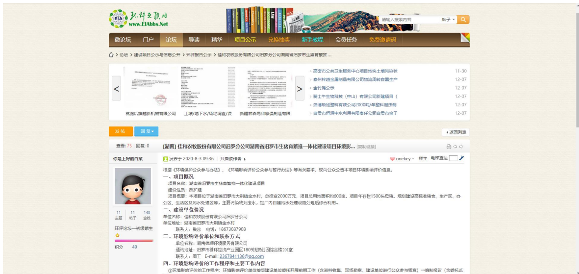
图 1 首次环境影响评价网站公示截图照片