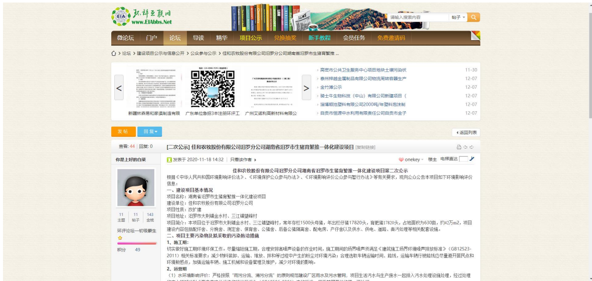
图 2 征求意见稿网上公示截图