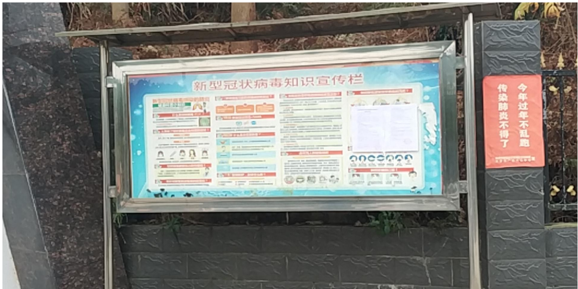
图4 项目现场公示照片