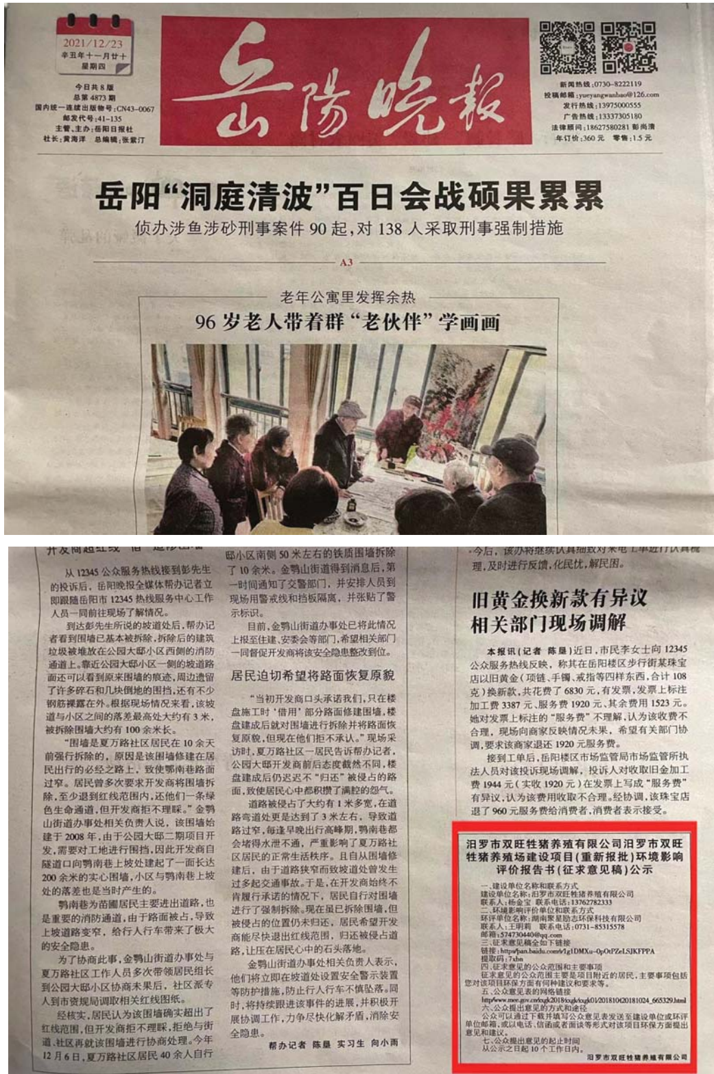
图 3.2-3 第二次报纸公示截图