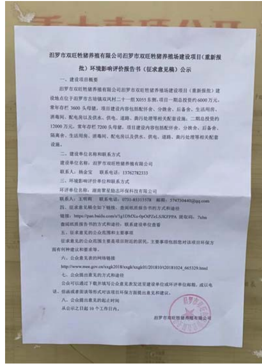
图 3.2-6 村委会公示栏现场公示