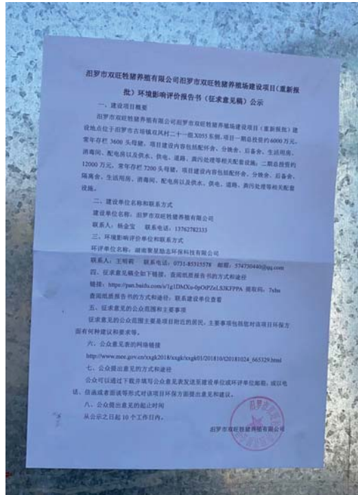
图 3.2-4 一期厂区现场公示