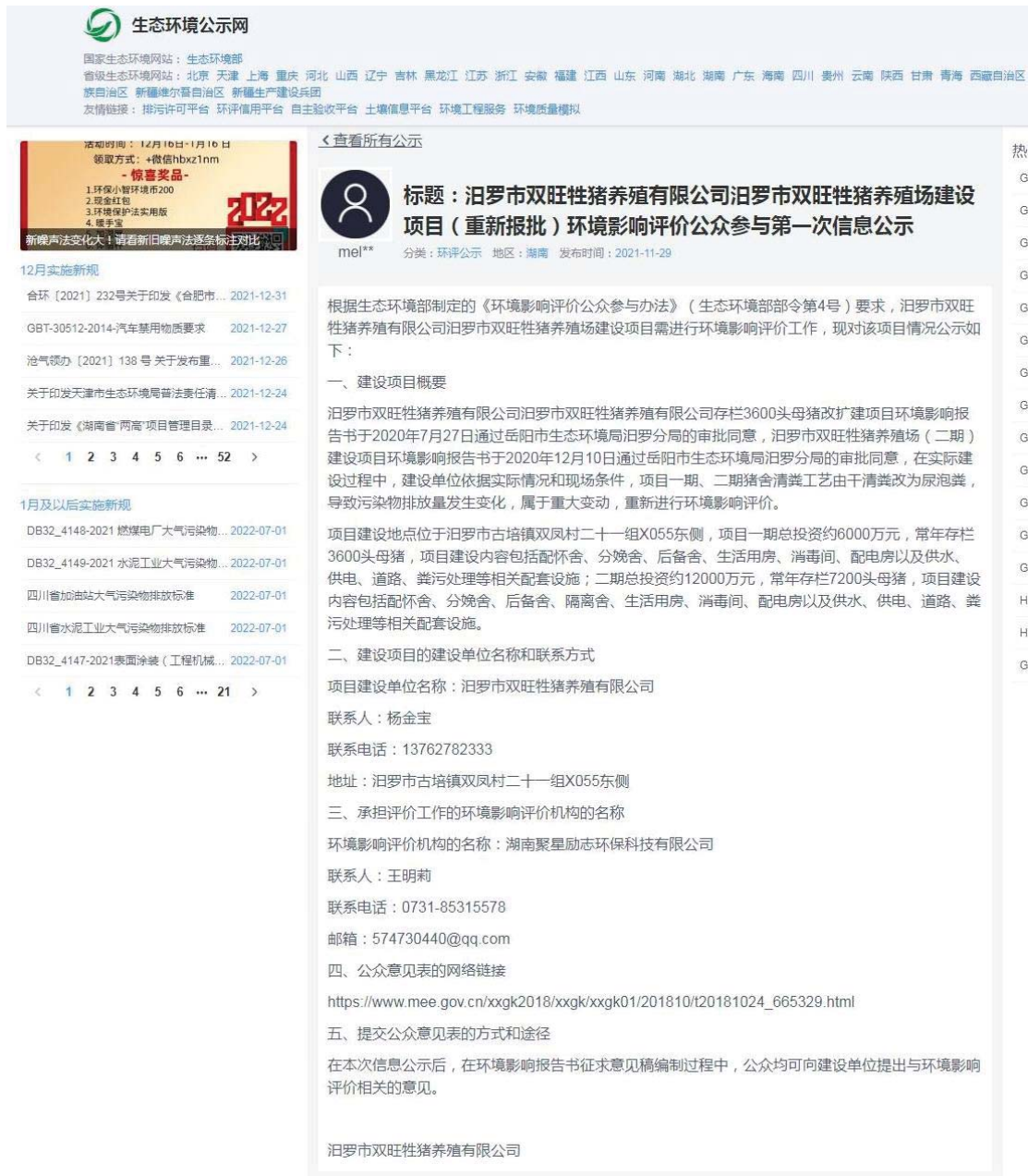
图 2.2-1 第一次网上公示截图