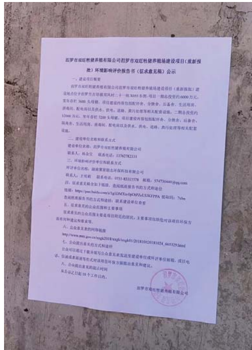
图 3.2-5 项目二期厂区现场公示