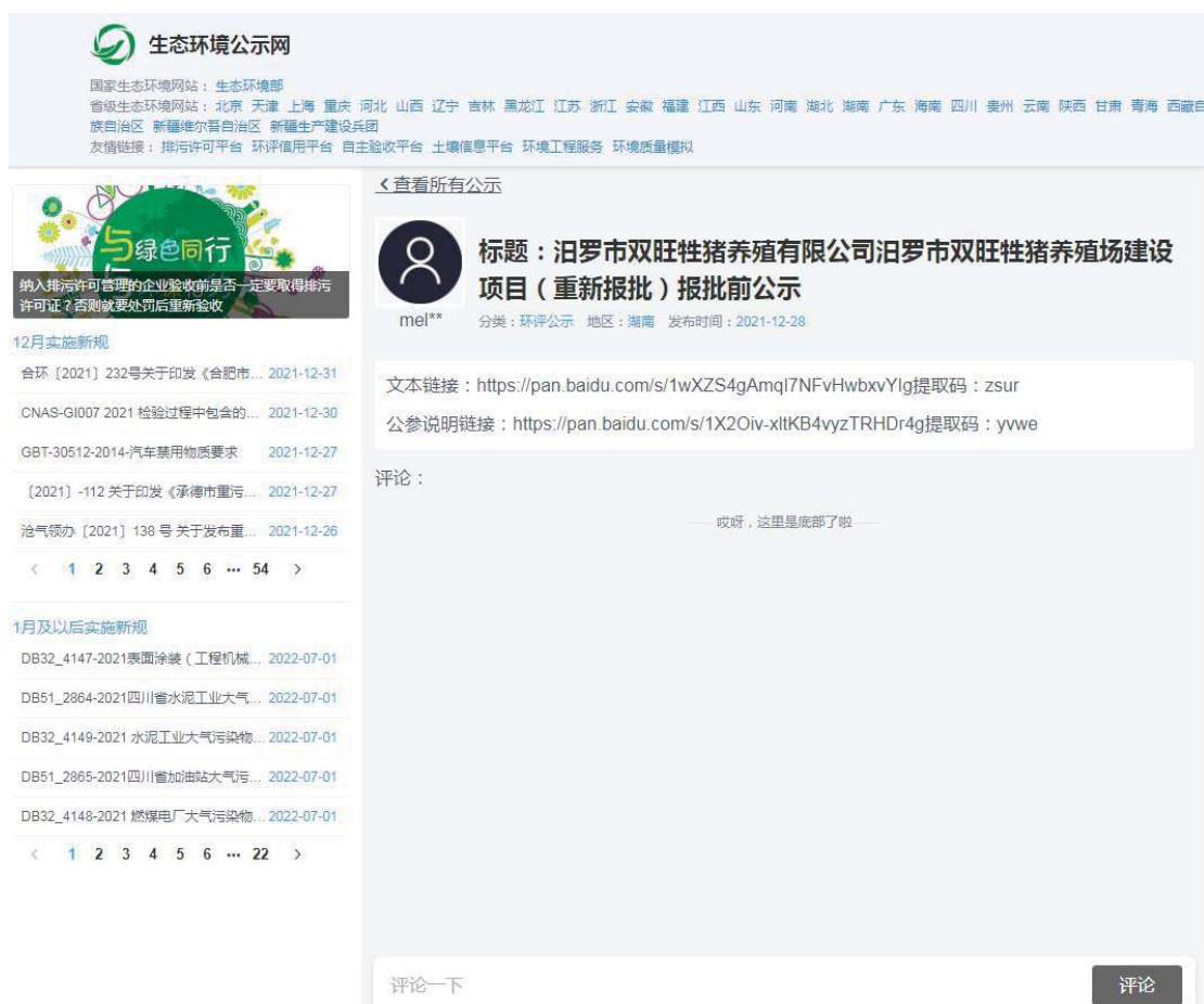
图 6-1 报批前网上公示截图

本次公示主要内容及日期均符合《环境影响评价公众参与办法》（生态环境部令第 4 号）“第二十条”的要求。