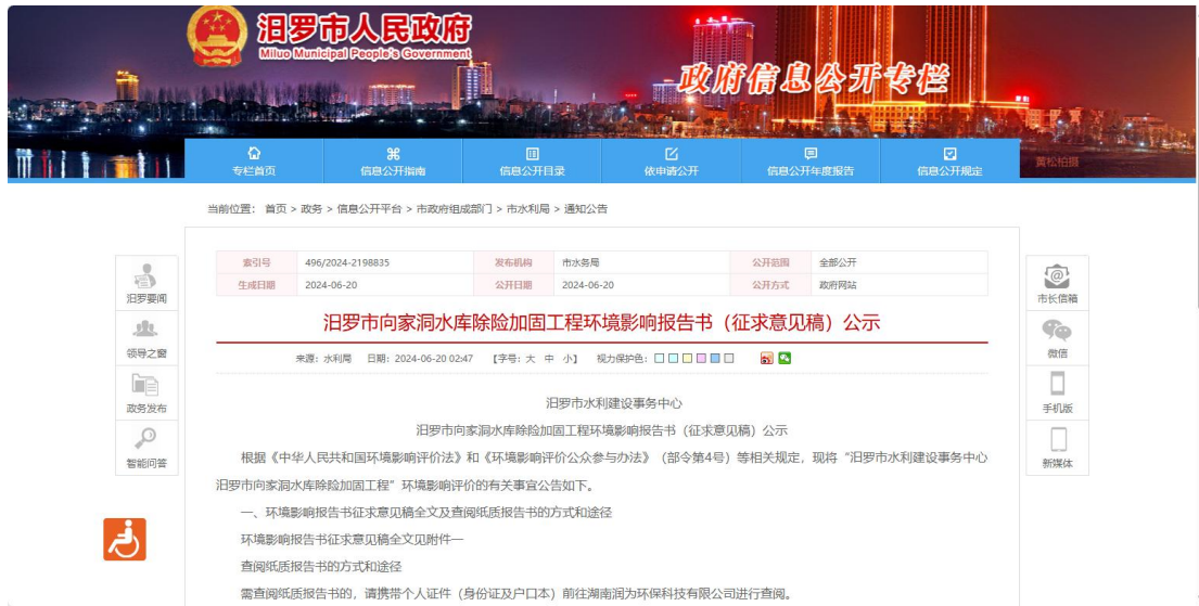
图 3.2-1 征求意见稿网上公示截图