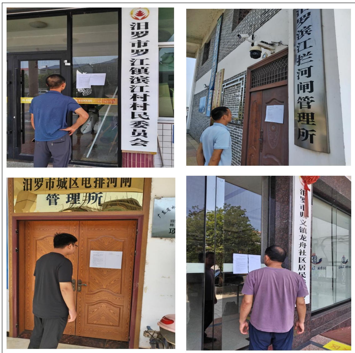
图 3.2-5 各社区张贴公示

2024年8月22日-9月3日,建设单位在滨江拦河闸管理所、滨江村委会、龙舟社区居委会等公众较多的场所张贴公告,具体张贴地点及部分现场照片,详见图3.2-5。