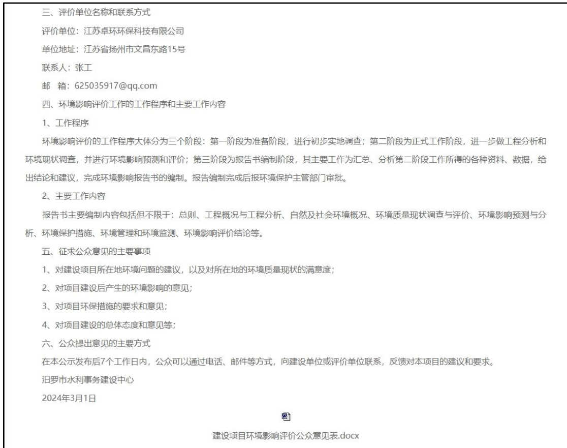
图 2.2-1 第一次网络公示截图(汨罗市政府)